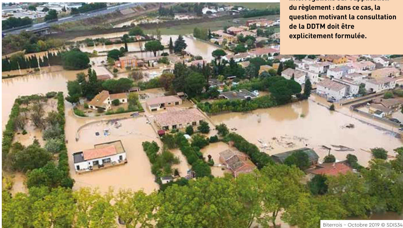
Biterrois – Octobre 2019