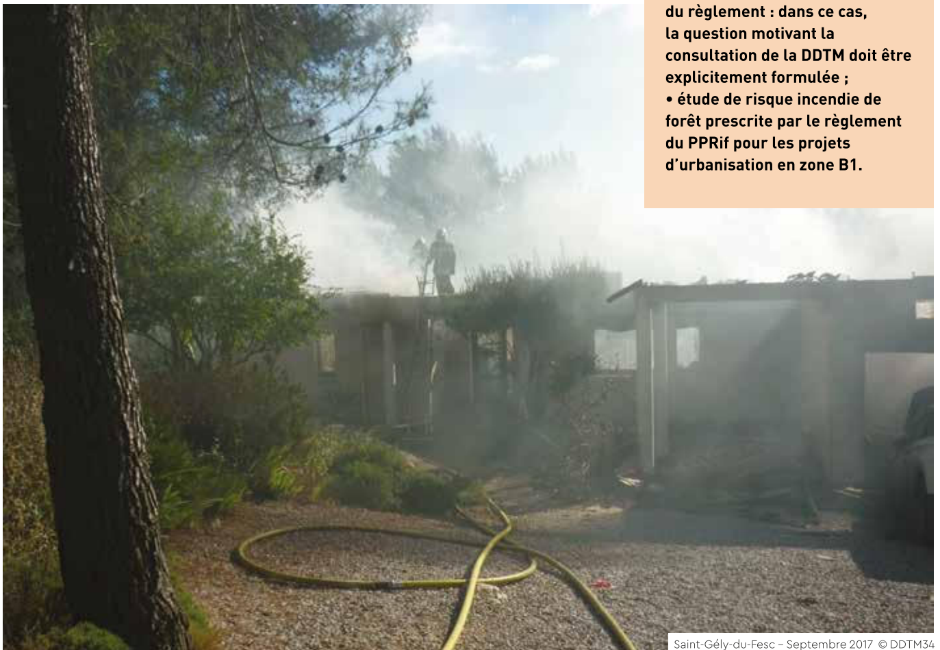
Saint-Gély-du-Fesc – Septembre 2017